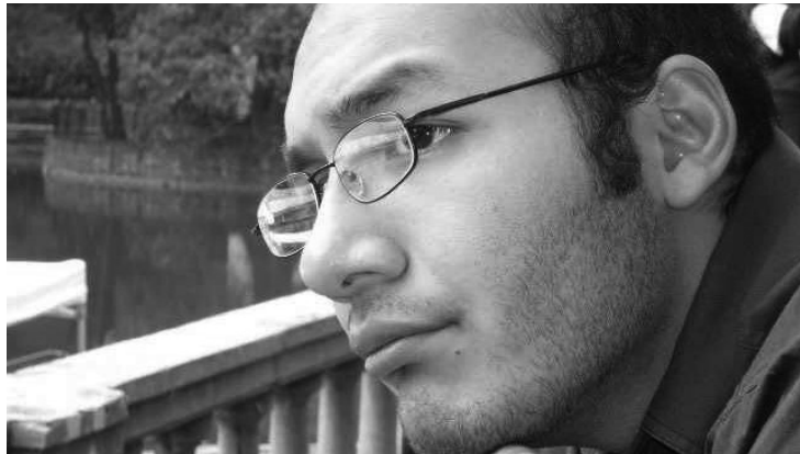
RAFAEL QUEZADA CRUCES (MÉXICO) | SOBRE LOS VERSOS DE JAINA (8'05")

Ensamble MUSLAB, invita a un concierto de música electroacústica y videoarte en Buenos Aires Argentina, un espectáculo gratuito, en formato de bóveda sonora de 5.1 canales con sonido envolvente donde se exhibirán composiciones de música electroacústica de artistas provenientes de México, Argentina, Francia, Finlandia y Taiwán.