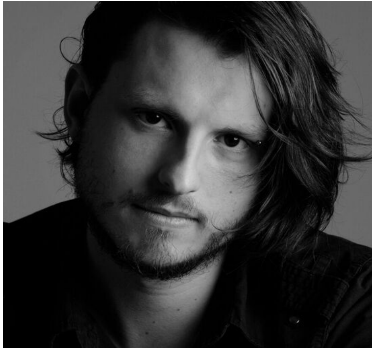
JAMES O'CALLAGHAN (CANADÁ) | ISOMORPHIC (10'02) www.jamesocallaghan.com

Isomorphic is part of a triptych of works in different media with the same form, using as material the same environmental sounds (the others are Isomorph for orchestra, and Isomorphia for orchestra and electronics). In this acousmatic piece, sound sources continually transform according to metaphorical and morphological comparisons. Isomorphic was commissioned by Codes d'accès and received an honorary mention in the 2015 Musica Nova competition.